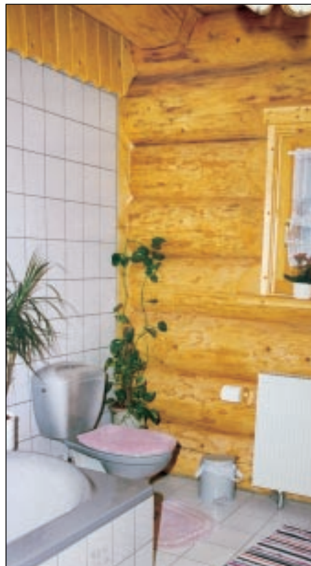
Badezimmer mit frei beweglicher Verbindung zwischen Blockwand und gefliester Innenwand.