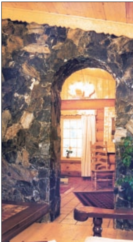
Bruchsteine fugenlos als Vorsatzmauerwerk verbaut mit Durchgang vom Wohnzimmer zur Diele.

Ein besonderes Meisterstück, und hier wurde nicht gespart, ist der doppelte offene Kamin. Diesen platzierte der Bauherr ins Zentrum des Hauses mit Ausrichtung in die Essecke und in das Wohnzimmer. Diese zentrale Einheit ist rundum begehbar. Auf der Wohnebene schläft der Hausherr im 'Master bedroom' mit eigenem Bad. Die Küche mit Esszimmer und das Wohnzimmer sind frontseitig angeordnet. Ein umlaufender Balkon besitzt Zugänge vom Schlafzimmer und der Küche bzw. vom Wohnzimmer. Zur Beheizung des Hauses reicht der Kamin mit einer Elektroheizung als 'Back up'. Im Keller installierte man einen 'Gas fireplace'. Alle Fußböden wurden auf einer leicht schwingenden Konstruktion aufgebaut, um