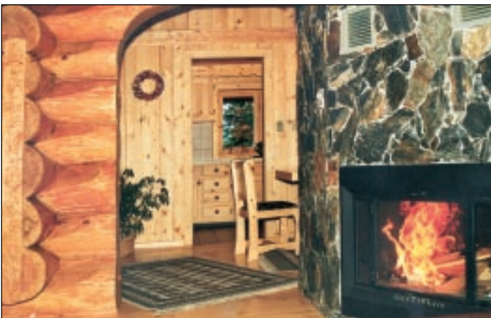
Blick in den Küchenbereich und die Essecke. Der Bruchsteinkoloss mit zwei 'Feuerstellen' ist rundum begehbar.

wurden bereits als verbesserte 'Saddle notch' und nicht als eine 'Round notch' ausgeführt. In der Außenschale besteht der Aufbau des Hauses aus vollen Stämmen, im Innern wurden nur zum Teil Blockwände gebaut. Hier bevorzugten die Bauherrn massiven Bruchstein, der nahezu fugenlos vermauert wurde. Die Trennwände auf einer Ständerkonstruktion wurden mit Holzpaneele verkleidet. Zum Ausgleich des Setzen montierte man unter der Decke Setzleisten, die dank der saubereren Ausführung perfekt über die Innenwände gleiten können. Auf der rechten Seite des Hauses konnte ein offener Carport in den Grundriss integriert werden.