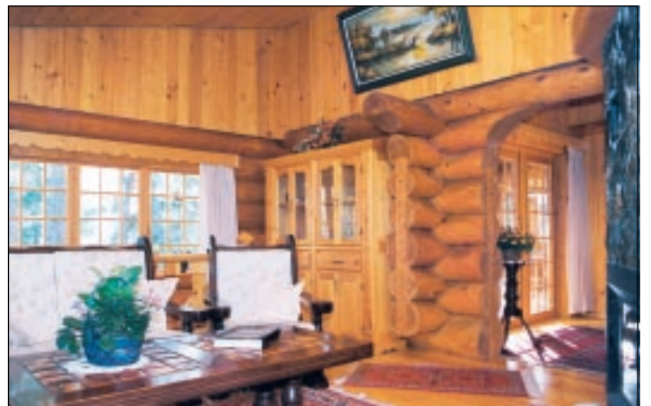
Das Wohnzimmer mit schräger Decke: Die Dachkonstruktion mit Scherendachbindern ermöglichte die hohen Räume.