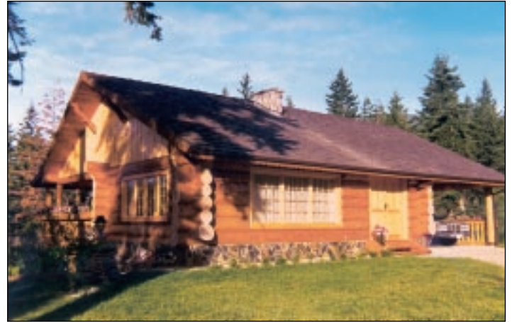
Die Eingangsseite des Baumstammhauses mit integriertem Carport, hier mit Blick auf den Wohnbereich im linken Hausteil.

E rfahrung im Blockhausbau bedeutet sich an alte Techniken und Ausführungen zu erinnern. Wer lange im Blockhausbau tätig war, kennt die Entwicklung nur zu genau. Insbesondere bei Häusern aus vollen Baumstämmen hat sich einiges getan: Balkenaufgaben, Setzverhalten und Eckverkämmungen konnten erheblich verbessert werden.