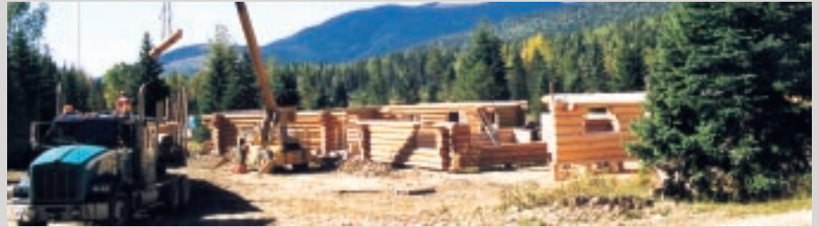
Der kanadische Bauplatz von Original Canada Blockhaus.

ein angenehmes Tritgefühl zu bewirken. Das komplette Blockhaus, einschließlich der Steinarbeiten, wurde vom Blockhausbauer ausgeführt. Mit einer gesamten Wohnfläche von etwa 180 Quadratmetern ein preiswertes handgefertigtes Meisterwerk, dessen moderne Blockbautechnik sich über 2 Jahrzehnte bewährt hat und keine Reklamationen verursachte.