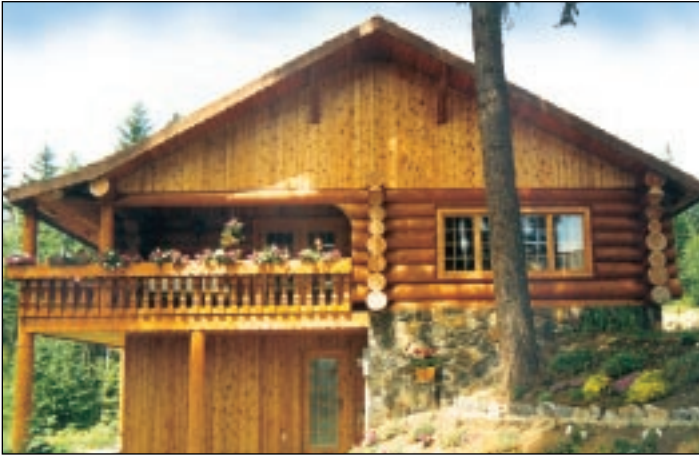
Die vorgefertigten 'Gang Nail'-Binder bieten eine preiswerte Dachkonstruktion, jedoch ohne Nutzung des Dachbodens.

Ein über 20 Jahre altes Haus aus vollen Stämmen ist eine Rarität. Zu Beginn der 80er Jahre wagten nur wenige Bauherrn, ein solches Baumstammhaus zu bauen. Während sich die Technik in diesem Zeitraum stark veränderte, blieben die Ideen zur Raumaufteilung erhalten.